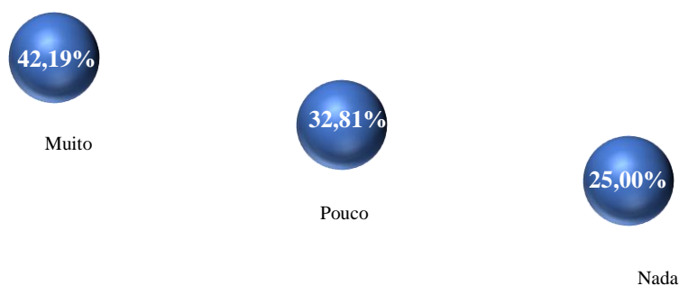
Gráfico 38: O quanto interfere a falta de vaga para estacionar na intenção de compra dos potenciais consumidores?

De acordo com os entrevistados, 42,19% indagaram que a falta de vagas para estacionar na região central de Campo Grande influencia muito (entre 66,66% a 100%) em suas intenções de compras, acarretando, inclusive, na desistência. Ficou evidente que os clientes são altamente sensíveis a falta de vaga para estacionar.